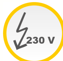
230 V Motor