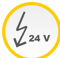
24 V Motor