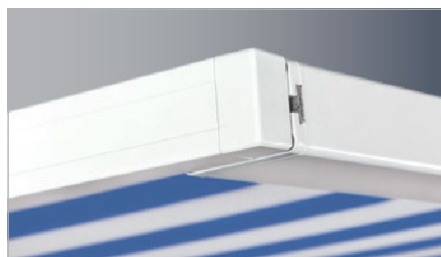
Endposition Fallstange bei ausgefahrener Markise