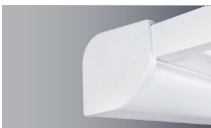
Der kompakte und formschöne Markisenkasten bietet optimalen Schutz für das Tuch

sich elegant unter das Terrassendach und sorgt für kühlenden Sonnenschutz. Die Terrassendach-Innenbeschattung bietet höchste Solarmatic-Qualität: Pulverbeschichtet sowie mit Schienenführung und Gegenzugsystem ausgestattet verbindet sie hochwertige Verarbeitung mit Komfort und Stabilität – und wertet auch optisch jede Terrasse auf.